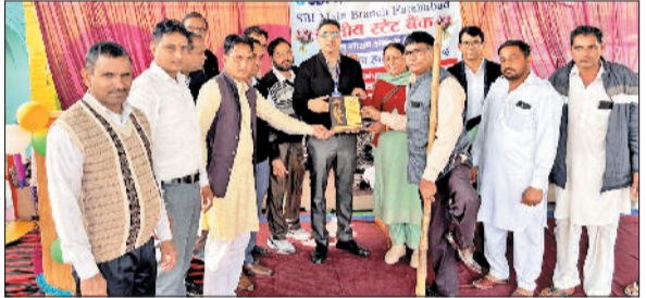
फतेहाबाद। धांगड़ प्राथमिक पाठशाला में बैंक अधिकारियों को सम्मानित करते स्कूल स्टाफ सदस्य।