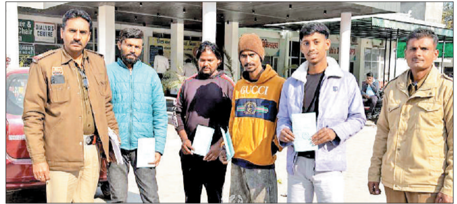
सिरसा। नशे से पीड़ित युवकों की काउंसलिंग करवाकर उन्हें अस्पताल से दवाई दिलवाते सिरसा पुलिस।