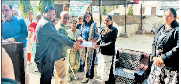
फतेहाबाद। बनगांव में अतिथियों का स्वागत करते प्रधानाचार्य।