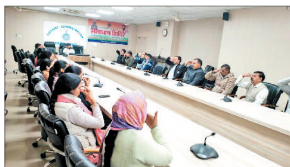
फतेहाबाद। लघु सचिवालय में कर्मचारियों को योगभ्यास करवाते आयुष योग सहायक जन्त।

लघु सचिवालय में उपस्थित सभी कर्मचारियों को वाई-ब्रेक योग