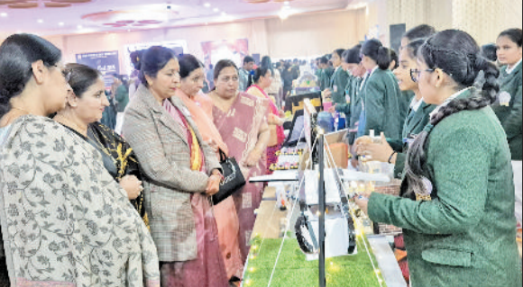
सिरसा। विद्यार्थियों द्वारा बनाए गए मॉडलों का निरीक्षण करते अतिथि।