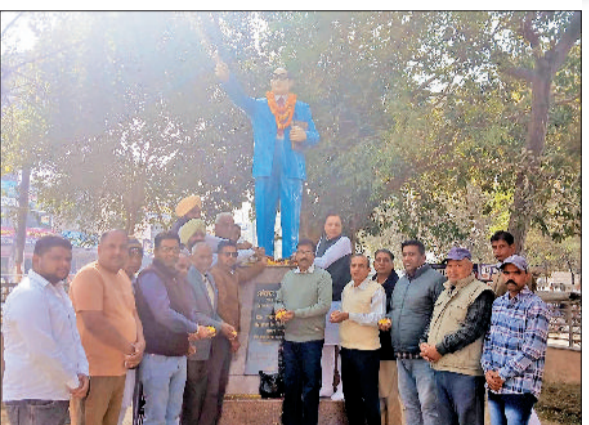
फतेहाबाद। डॉ. भीमराव अंबेडकर के चित्र पर श्रद्धासुमन अर्पित करते बीजेपी नेता डॉ. अंबेडकर को श्रद्धांजलि अर्पित करते कांग्रेसजन।