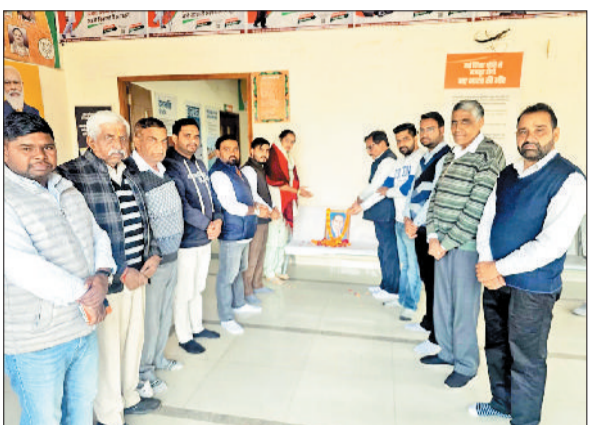
फतेहाबाद। डॉ. भीमराव अंबेडकर के चित्र पर श्रद्धासुमन अर्पित करते बीजेपी नेता डॉ. अंबेडकर को श्रद्धांजलि अर्पित करते कांग्रेसजन।