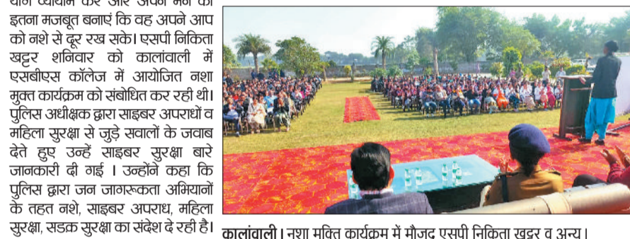
कालावाली। नशा मुक्ति कार्यक्रम में मौजूद एसपी निकिता खट्टर व अन्य।

कालावाली। पुलिस अधीक्षक निकिता खट्टर ने कहा कि नशे के कारण बहुत सी समस्याएं पैदा होती हैं जिसमें सबसे पहले हैं स्वास्थ्य संबंधित समस्याएं, जिसमें व्यक्ति अंदर से खोखला होने लगता है और व्यक्ति अपनी धन संपत्ति को नशे में उड़ाने लगता है और पैसा खत्म होने के बाद वह चोरी लूट जैसी वारदातों को अंजाम देना शुरू कर देता है। उन्होंने बताया कि उक्त समस्याओं से बचने का एक ही उपाय है कि आप नशे से दूर रहें तथा जिस व्यक्ति को नशे की लत लग चुकी है वह योग्य व्यायाम करें और अपने मन को इतना मजबूत बनाएं कि वह अपने आप को नशे से दूर रख सके। एसपी निकिता खट्टर शनिवार को कालावाली में एसबीएस कॉलेज में आयोजित नशा मुक्त कार्यक्रम को संबोधित कर रही थीं।