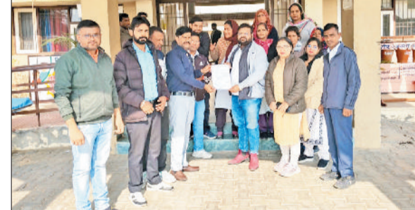
चोपटा। चिकित्सा अधिकारी को सीएम के नाम ज्ञापन सौंपते कर्मचारी।