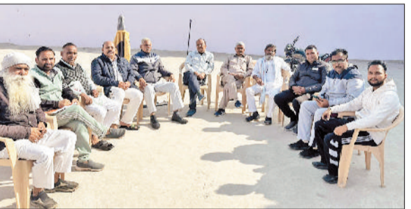
सिरसा। बैठक में भाग लेते सीमा ड्रस्ट के सदस्य।

विजेताओं तथा अर्धवार्षिक परीक्षा में सर्वश्रेष्ठ स्थान प्राप्त करने वाले 270 विद्यार्थियों को सम्मानित किया गया। कार्यक्रम में मोंट द्वितीय से लेकर बारहवीं कक्षा तक के विद्यार्थी शामिल हुए। सभी विद्यार्थियों को सम्मान चिन्ह तथा प्रमाण पत्र प्रदान किए गए। अलंकरण समारोह के अंतर्गत सत्र 2025 के लिए कक्षा प्रतिनिधियों सहित विद्यालय के हेड बॉय और हेड गर्ल का चयन किया गया। इसमें मोंट द्वितीय से गौरव व